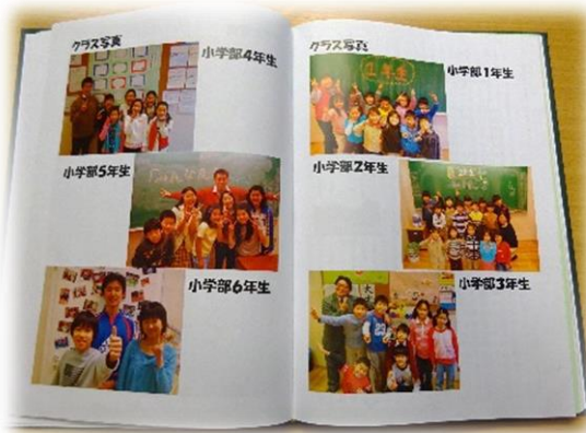
文集内のクラスのページ