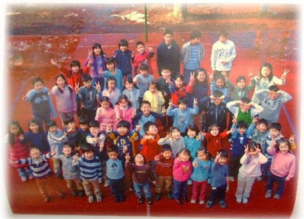
開校年の全校児童生徒