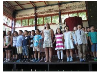
【子どもの日交流会】

1つ目は、小学部の Virányos 校や中学部の Városmajori Gimnázium 校との交流です。これらの交流では、ハンガリー語や英語を使ってコミュニケーションをとったり、同世代の児童や生徒たちと関わったりすることで、ハンガリーの習慣や文化について知ることを目的としています。小学部では「子どもの日交流会」と